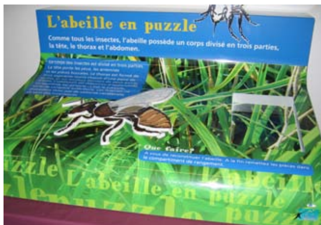
© Altec - CCSTI de l'Ain