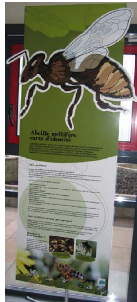
© Altec - CCSTI de l'Ain