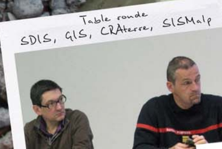
Table ronde SDIS, GIS, CRATERre, SISMALP