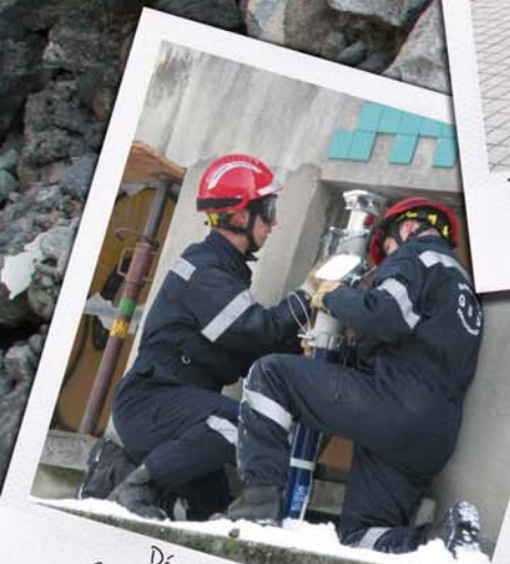
D monstrations Sauvetage & D blaiement SDIS 74 - 100 personnes pr sentes