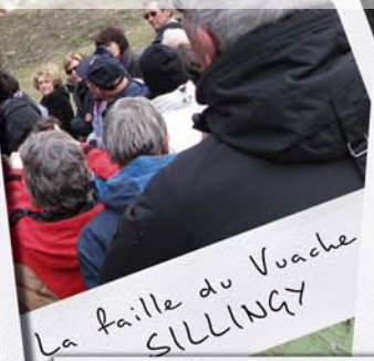
La faille du Vuache SILLINGY