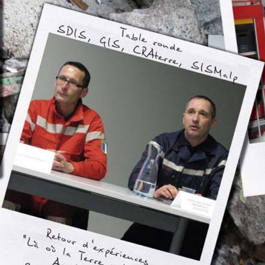
Table ronde SDIS, GIS, CRATERre, SISMALP