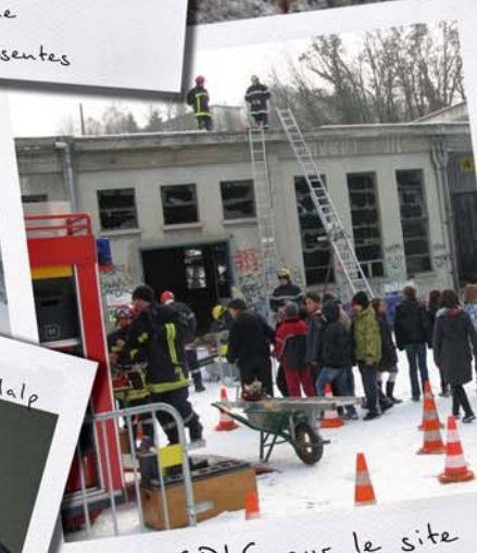
Le SDIS sur le site des papeteries