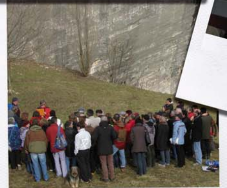
Sortie terrain g ologique Faille du Vuache - SILLINGY 60 personnes pr sentes