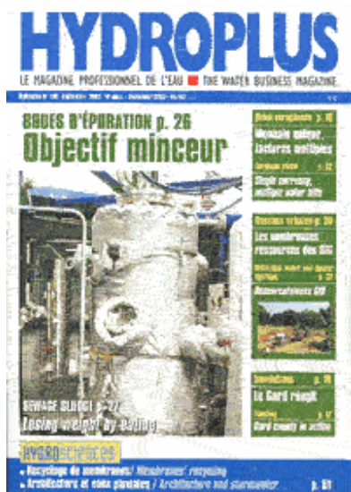
Hydroplus : le magazine professionnel de l'eau.-